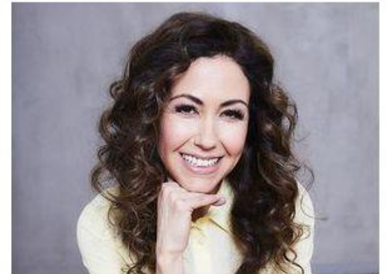
Anastasia Zampounidis, Botschafterin für „Gesunde Ernährung“